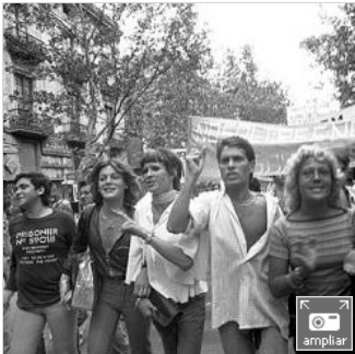
manifestación del Día del Orgullo Homosexual en Barcelona, en 1977